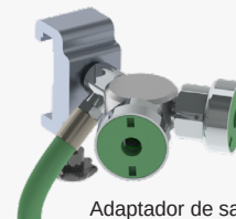
Adaptador de salidas de oxígeno diamante dual Y montado en riel