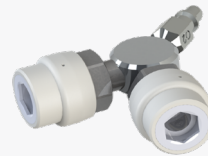
Adaptador de salidas de oxígeno DIN dual Y